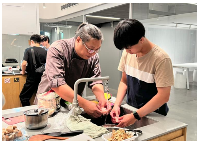
講師個別指導，適時協助調整