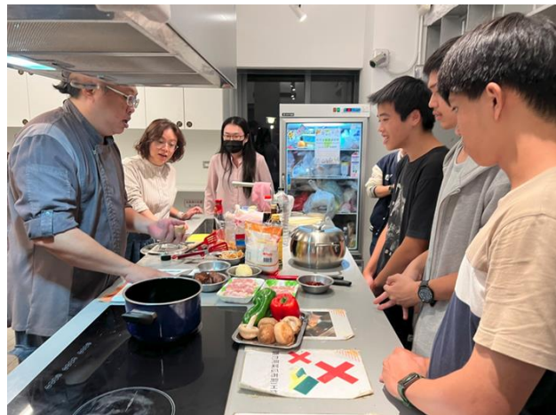
住服組組長與同仁一同學習