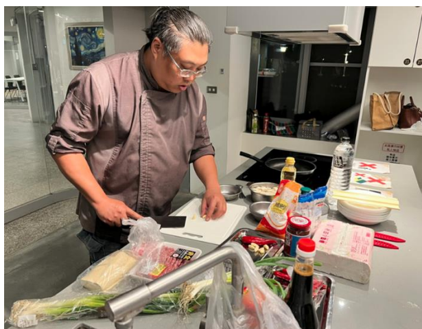
講師說明食材運用與運刀技巧